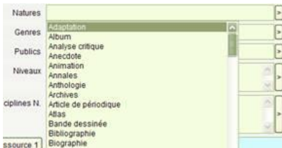
La fenêtre des nomenclatures du champ Natures

Prenons par exemple, le champ Natures : cliquez sur le petit bouton à droite du champ (remarquez que ce petit bouton est différent du bouton des nomenclatures des champs fermés) :