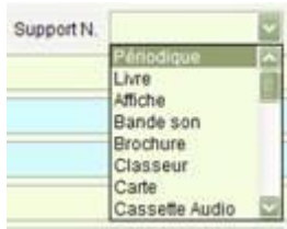
Un exemple de champ fermé et sa fenêtre des nomenclatures

Vous pouvez taper une initiale (ou utiliser l'ascenseur) pour vous déplacer rapidement dans la liste puis cliquer sur la forme à capturer.